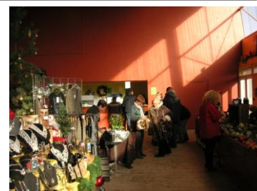
Marché de Noël 2010