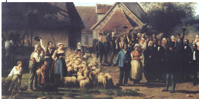
Le passage de NAPOLEON III à la ferme du Coudray, BRINON sur SAULDRE , le 22 avril 1852 (extrait) par le peintre Raymond-Noël ESBRAÏ. Musée des beaux arts d'ORLEANS

Le 22 Avril 1852, LOUIS-NAPOLEON arriva vers 6 heures du matin à la gare d'Orléans pour se rendre en SOLOGNE, par la ligne du Centre (Orléans-Bourges) jusqu'à Lamotte-Beuvron. Puis le cortège comprenant 7 voitures (à chevaux) se dirigea vers Vouzon, Souvigny, Chaon, Brinon (où le déjeuner devait avoir lieu) et repartit ensuite vers Lamotte-Beuvron.