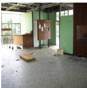
Mille Clubs en travaux

A noter que contrairement à ce qu'on dit les journaux, ce sont bien les employés de la commune qui ont fait tous ces travaux.