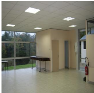
Nouveau Mille Clubs

Le club des Aînés de Brinon sous la présidence d'Edith JULLIEN se réunit tous les mercredis après-midi au 1000 clubs. Ils sont de 15 à 25 personnes et jusqu'à 30 les jours où ils font des concours de belote et ce environ toutes les 6 semaines. 2 repas sont servis, le premier fin juillet au 1000 clubs, le second aux environs de Noël à la salle Jean BOINVILLIERS celui-ci est ouvert à tous.