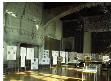
Vue d'ensemble de la Salle du Duc Jean