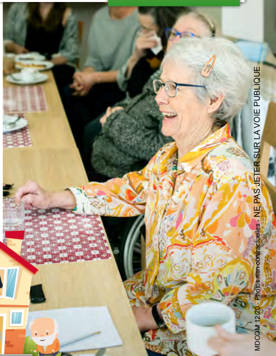
MDCoM_12/20 - Photos non-contractionnelles - NE PAS JETER SUR LA VOIE PUBLIQUE